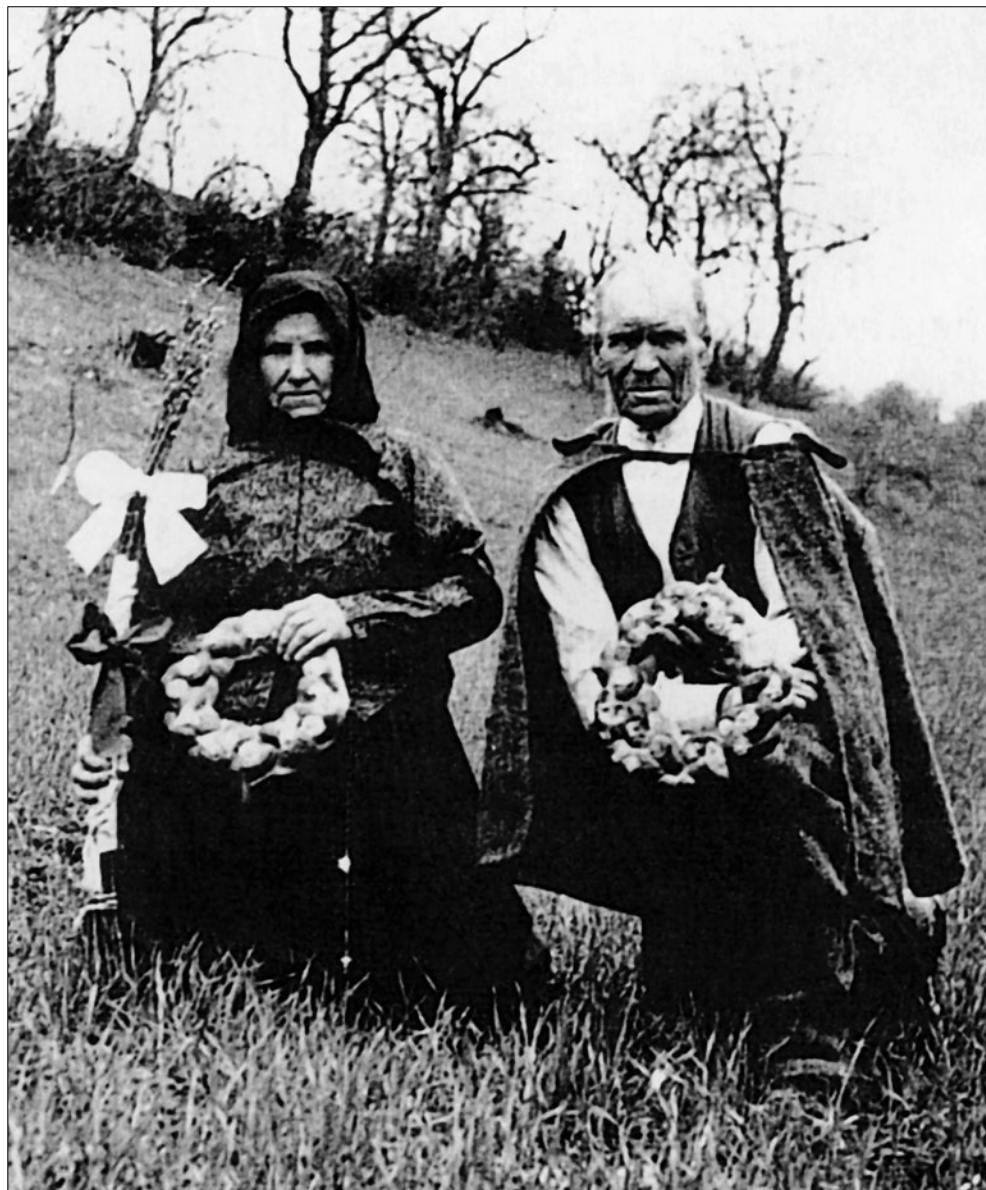
Obchádzanie chotára na sv. Marka. Kruhové koláče boli symbolom plodnosti. Jastrabá. R. Bednárík, 1935.