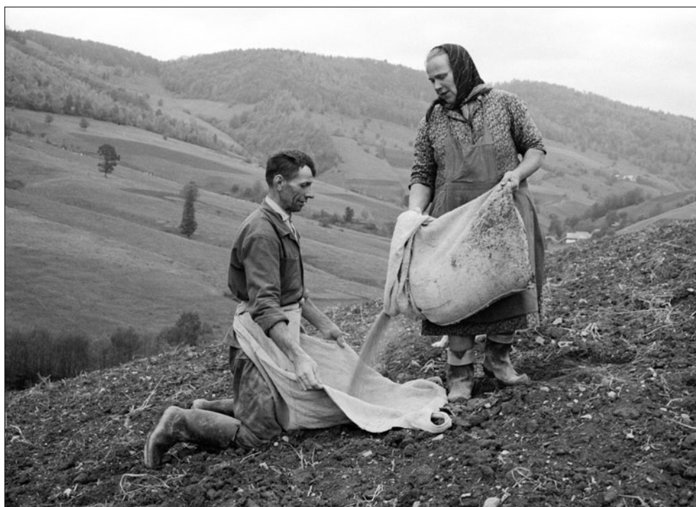
Nasýpanie osiva do rozsievky. Liesnica. J. Dérer, 1961.