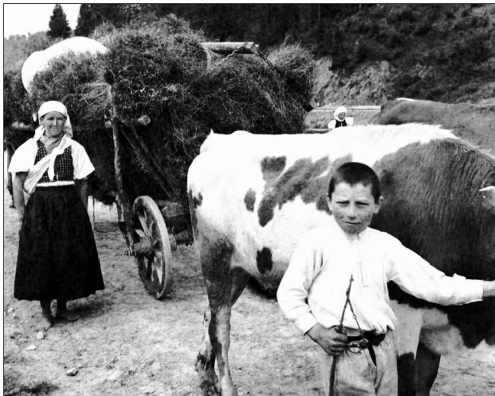
Zvážanie ľanu. Čierny Balog. Neautorizované.