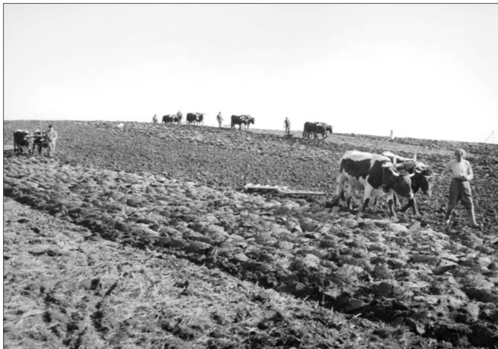
Bráňenie pôdy. JRD Sklabiňa. J. Dérer. 50. roky 20. storočia.