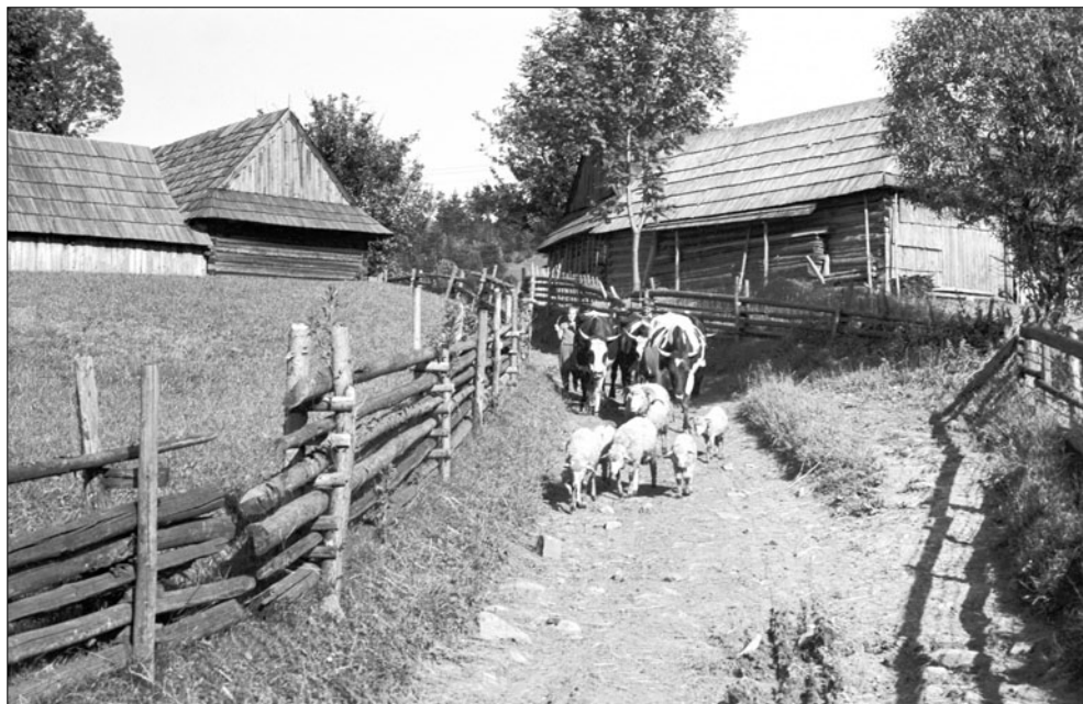
Cestou na pašu. Osturňa. J. Ušák, 1972.