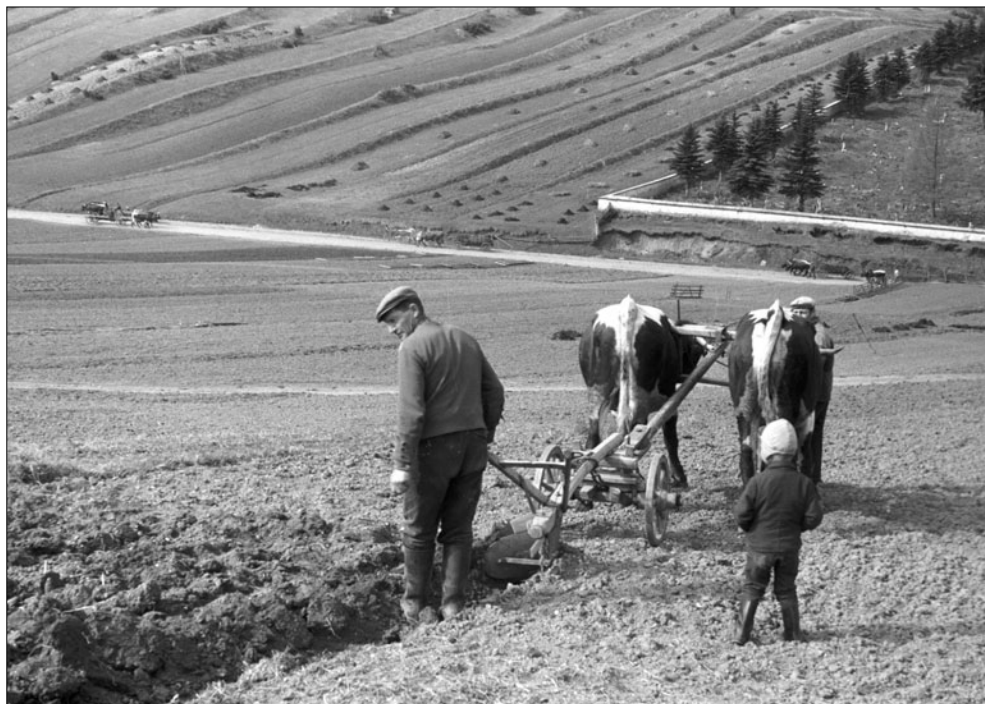
Kontrola brázdy. Liptovská Teplička. N. Tomanová, 1972.