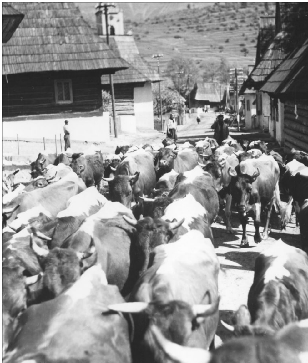
Vyháňanie statku na pašu. Zuberec. I. Grossmann, 1956.