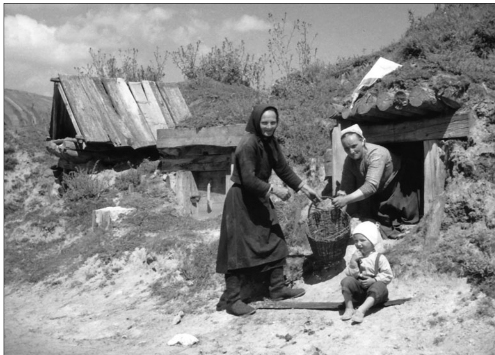
Pivnice na zemiaky. Liptovská Teplička. L. Baran, 1951.