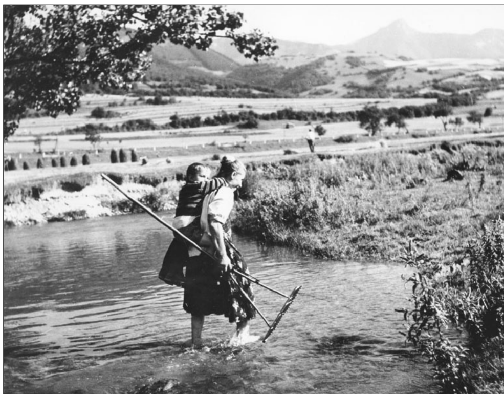
Cestou na lúky. Rajecká Lesná. I. Grossmann, 50. roky 20. storočia.