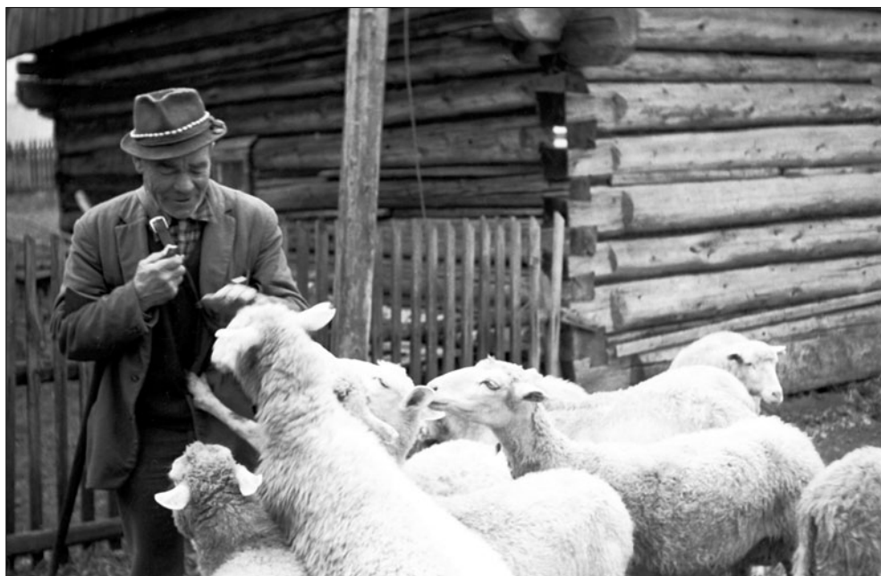
Výhon oviec. Vyšná Boca. J. Botík, 1974.