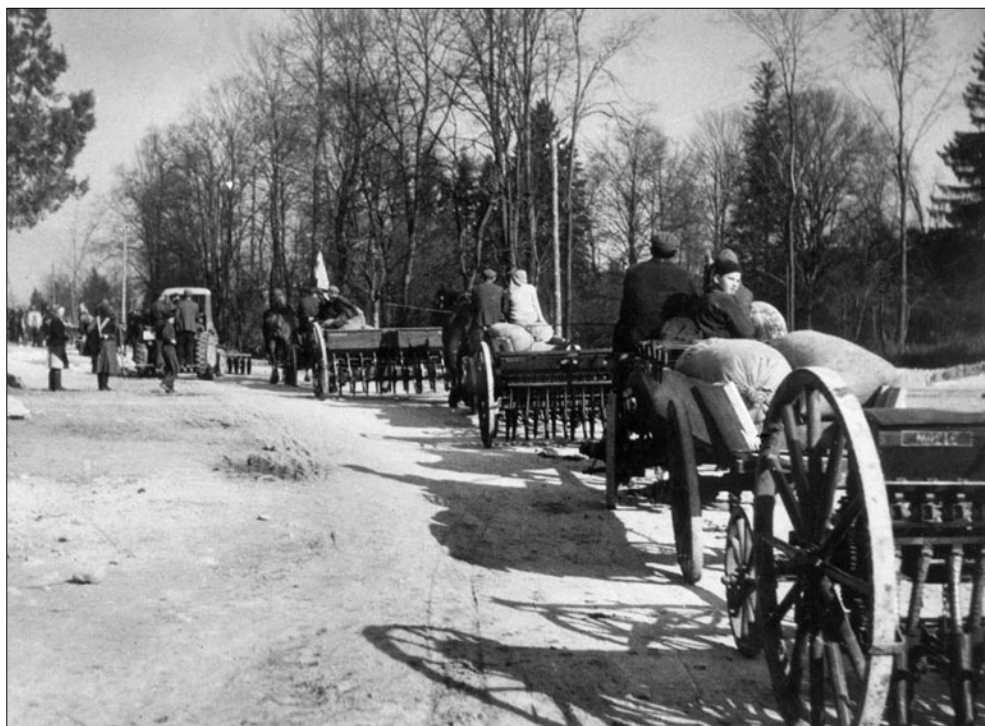
Sejačky. Prvá mechanizácia JRD Rudno. J. Dérer. 50. roky 20. storočia.