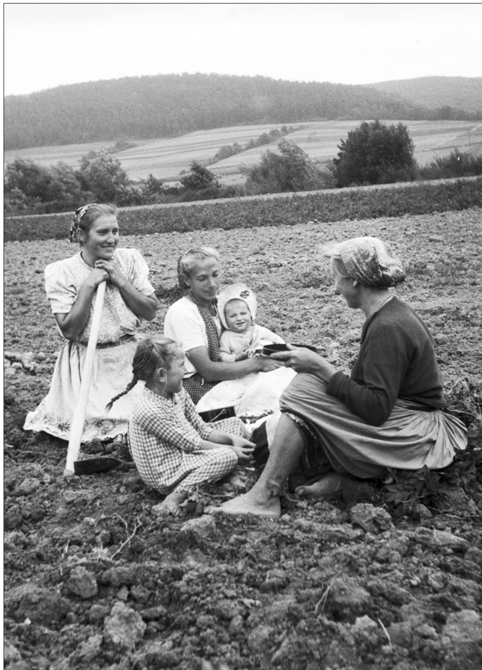
Obed na poli. Merník. Cího, 1950.